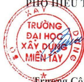
Trương Công Bằng