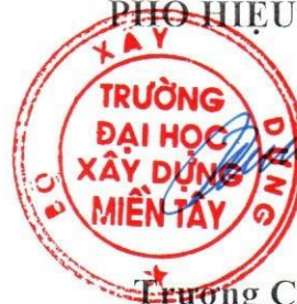
Trương Công Bằng